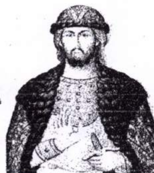
«Имя России» св. князь Александр Невский

Российский союз неправительственных организаций «Отечество» при содействии Совета Федерации Федерального Собрания РФ, Государственной Думы РФ; Патриархии, при поддержке Министерства культуры РФ, Министерства образования РФ, Мэрии г. Москвы, Федерального агентства по делам молодежи, Российской академии естественных наук, Торгово-Промышленной Палаты РФ, Федерации Независимых Профсоюзов России, Федерации профсоюза работников связи России и Федерации профсоюза работников агропромышленного комплекса России проводит ко Дню России с 7 по 9 июня 2017 года Всероссийский конкурс - фестиваль патриотической песни и народного танца детского, юношеского и молодежного творчества « Молодые таланты Отечества »