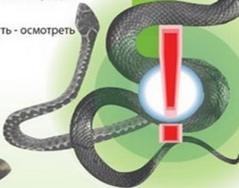
Обыкновенная гадюка единственная ядовитая змея